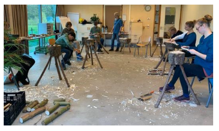
"Lighter" green activities