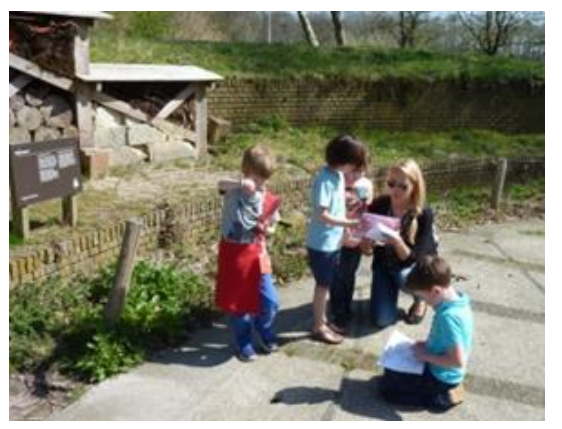
Spring is coming....