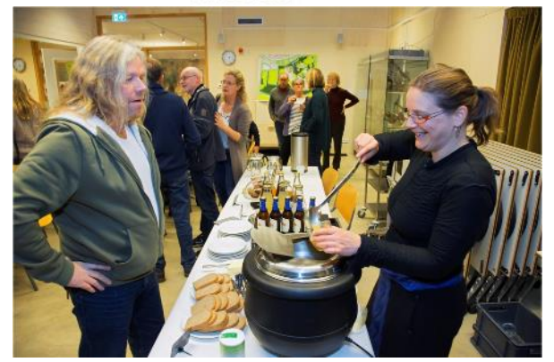
Meeting each other