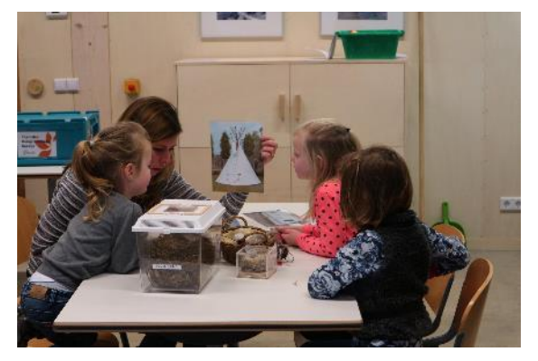
Our own lessons & projects