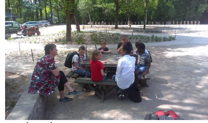
Be the change you want to see