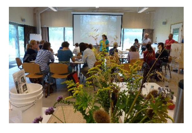
"Darker" green activities